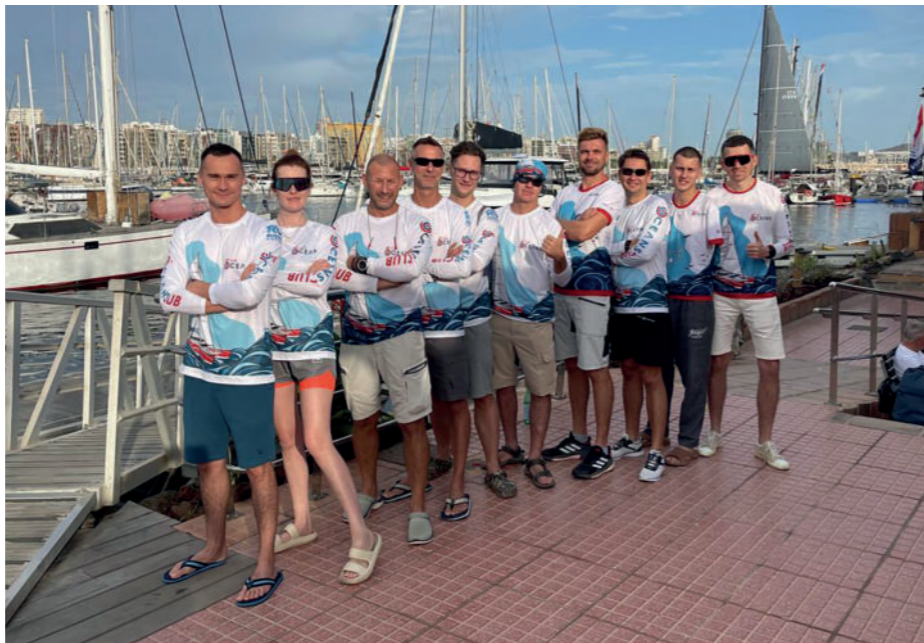
24 ноября 2024 г. команда клуба отправилась во вторую кругосветную экспедицию

В ноябре 2024 г. команда клуба «5 океанов» отправилась во вторую кругосветную экспедицию, одним из партнеров которой выступил Музей Мирового океана.