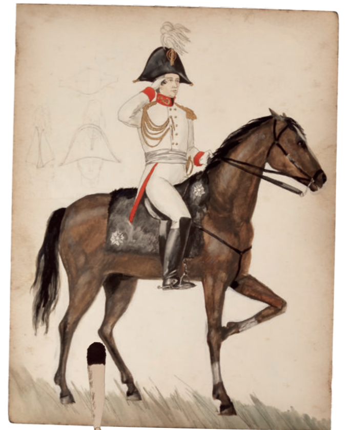
Генерал-адъютант. Русская армия. 1812 г.