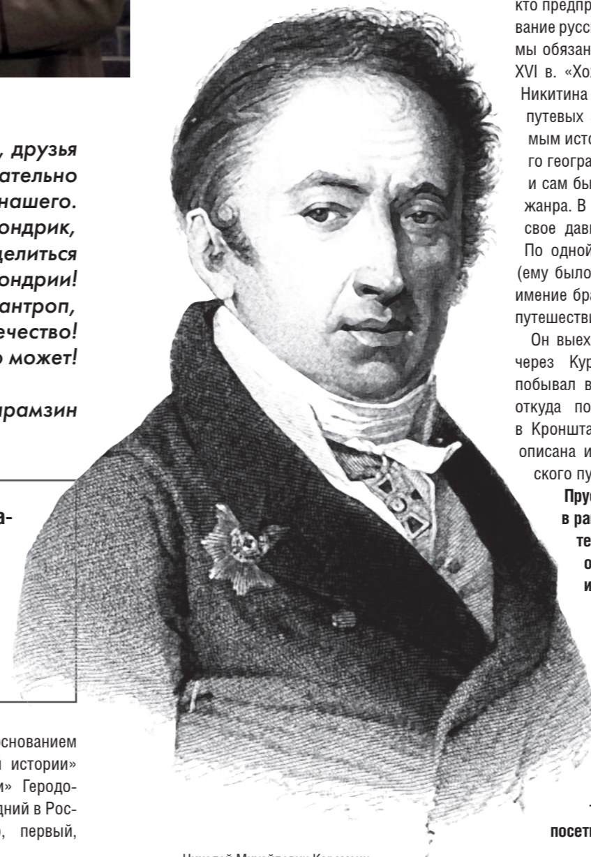
Николай Михайлович Карамзин Портрет работы Н.И. Уткина

Н.М. Карамзина с полным основанием можно считать «отцом русской истории» по аналогии с «отцом истории» Геродотом. Карамзин – первый и последний в России придворный историограф, первый,