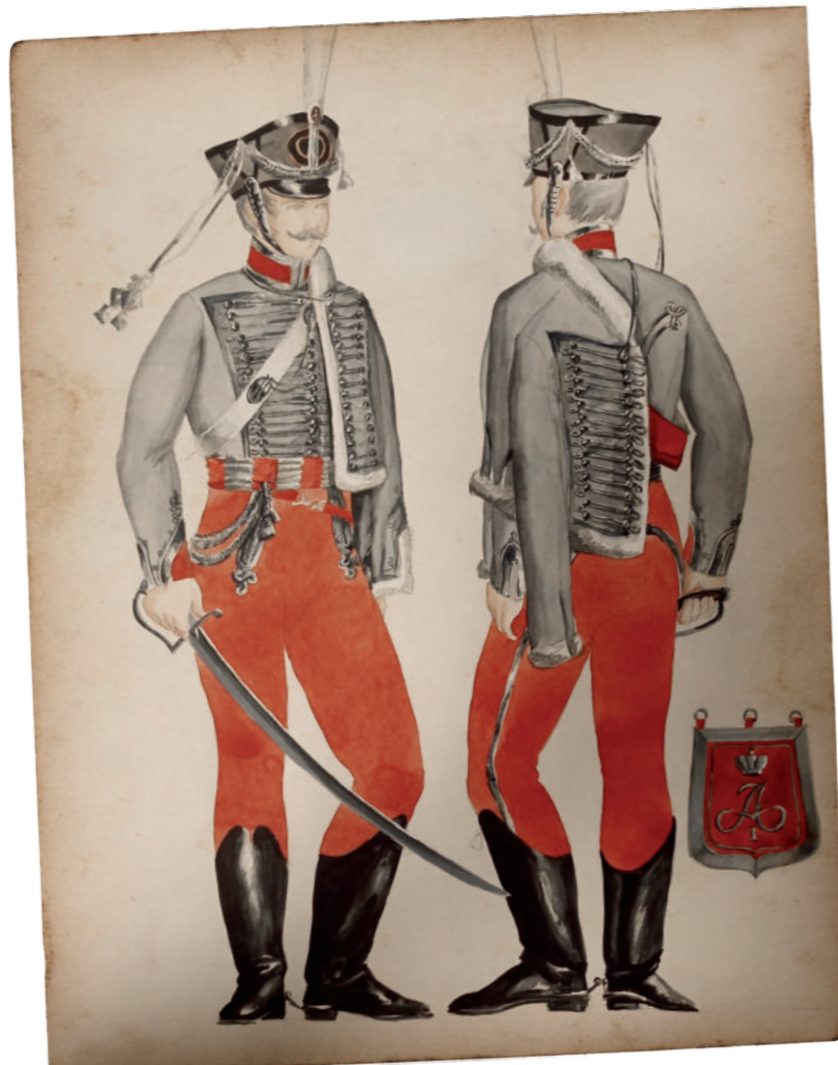
Обер-офицер Сумского гусарского полка. Русская армия. 1812 г.