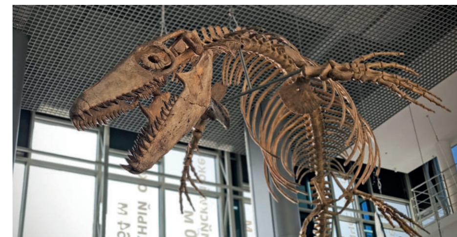
Новый обитатель «Глубины» – мозазавр