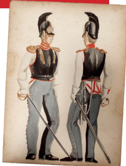
Обер-офицер лейб-гвардии Конного полка. Русская армия. 1812 г.