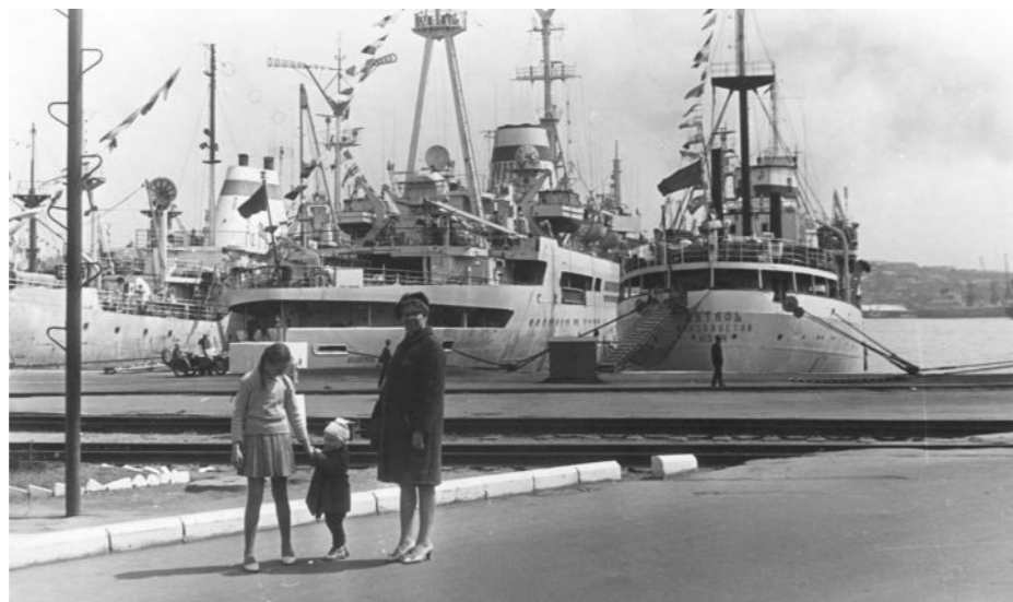
Корабли науки во Владивостоке. 7 ноября 1970 г.

активное движение сухогрузов, военных кораблей и яхт. Лучший вид на бухту и Золотой мост через нее открывается с сопки Орлиное гнездо высотой 199 м — это самая высокая точка исторической части города. Гиды рассказывают, что в хорошую погоду