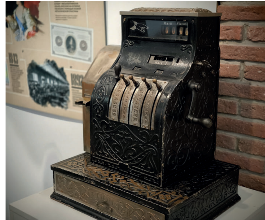
Аппарат кассовый. 1908. Германская империя. Металл, заводское производство

В декабре Музей Мирового океана представил новый выставочный проект «Деньги: от каури до рубля», посвященный 300-летию со дня основания в 1724 г. Петром Великим Монетного двора в Санкт-Петербурге и 35-летию музея. На выставке можно узнать об истории бытования денег: чем пользовались люди до появления денежных средств, как они менялись, из каких материалов делались, какой вклад Россия внесла в мировую историю денег и многое другое.