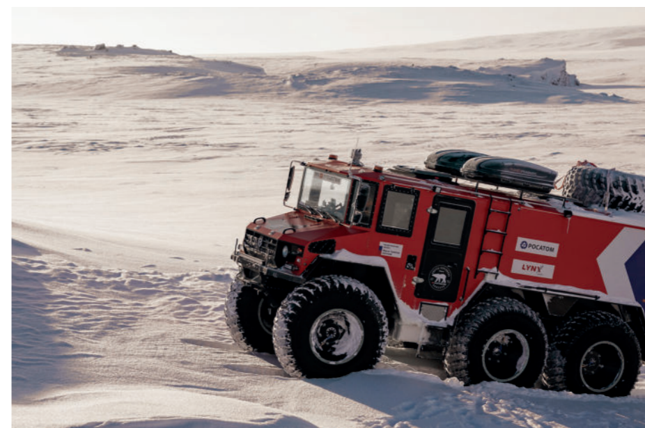
Команда экспедиции объехала всю Россию на вездеходных машинах «Бурлак» отечественного производства

Участники континентальной экспедиции «Россия 360» в рамках рабочего визита в Калининградскую область обсудили сотрудничество с комплексным морским музеем.