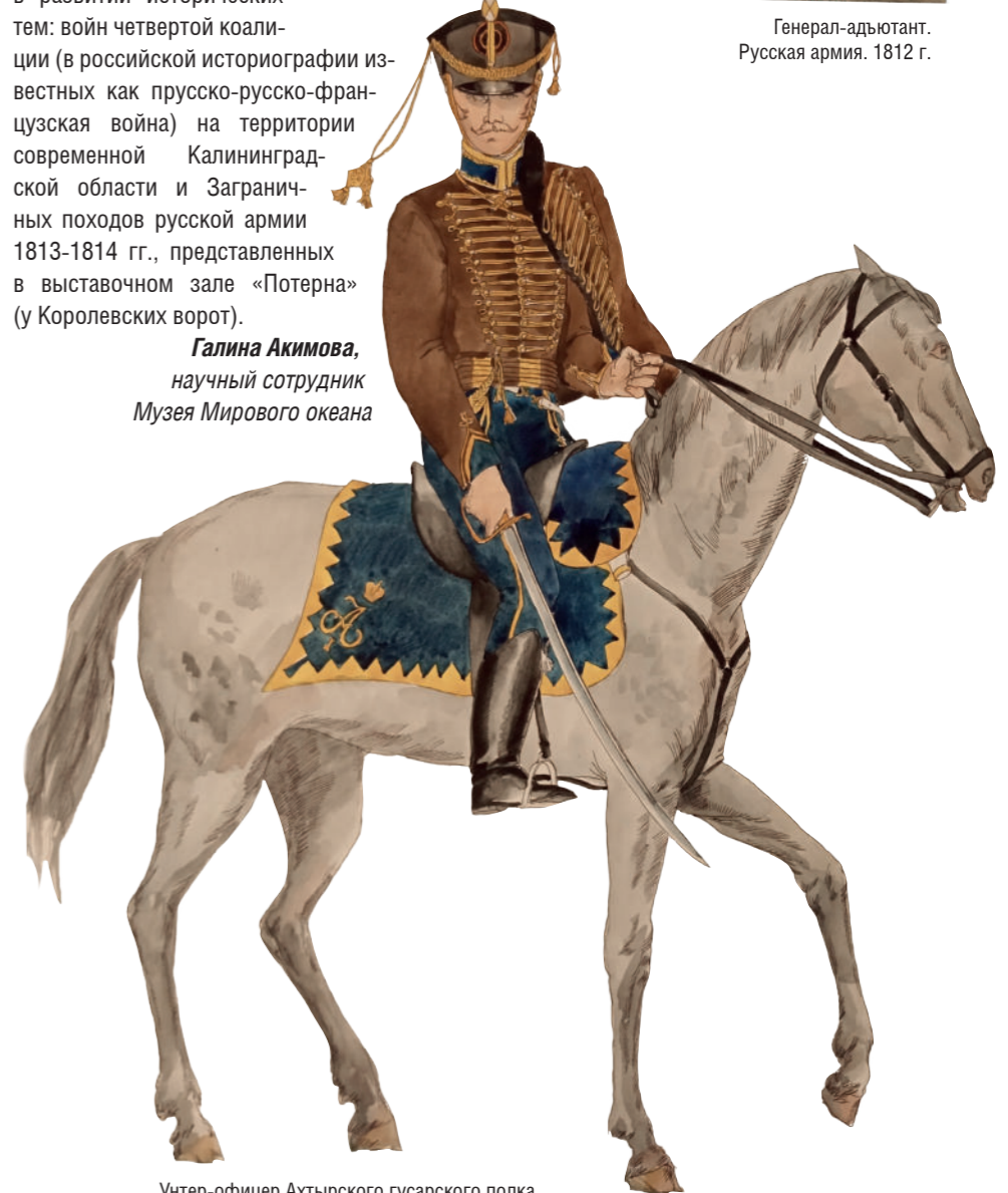
Унтер-офицер Ахтырского гусарского полка. Русская армия. 1812 г.