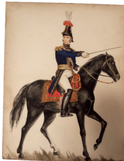
Дивизионный генерал армии Наполеона. 1812 г.