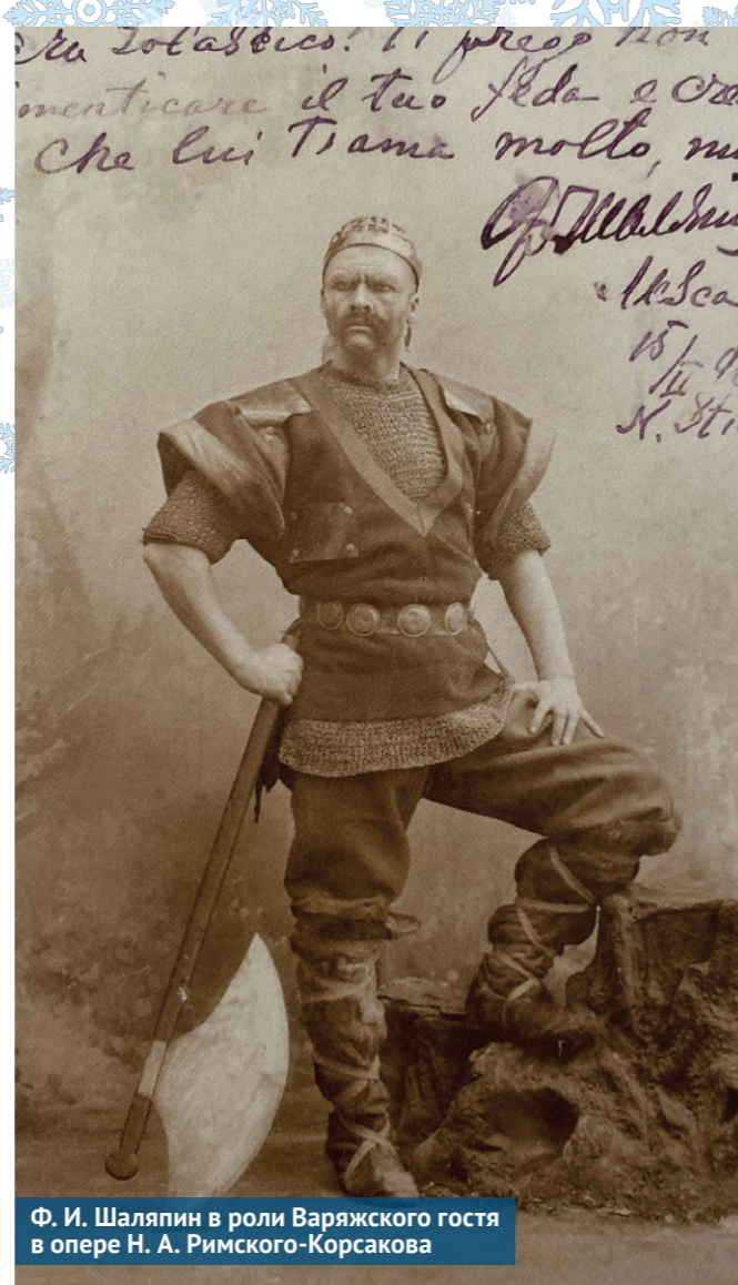
Ф. И. Шаляпин в роли Варяжского гостя в опере Н. А. Римского-Корсакова