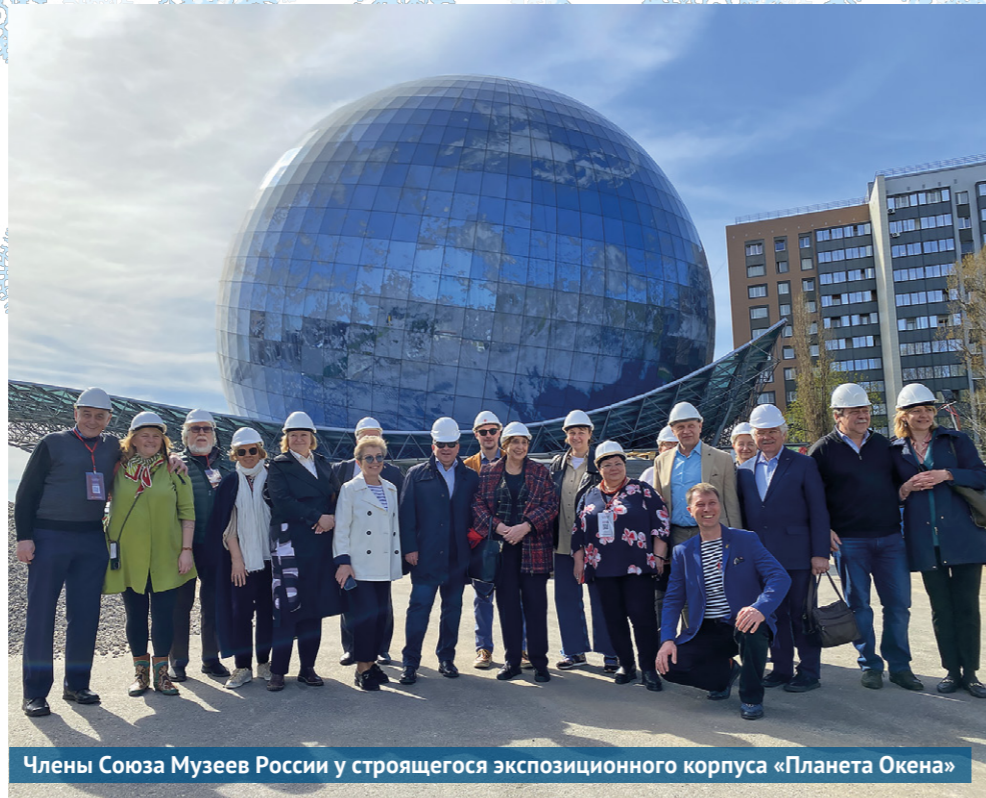
Члены Союза Музеев России у строящегося экспозиционного корпуса «Планета Океана»