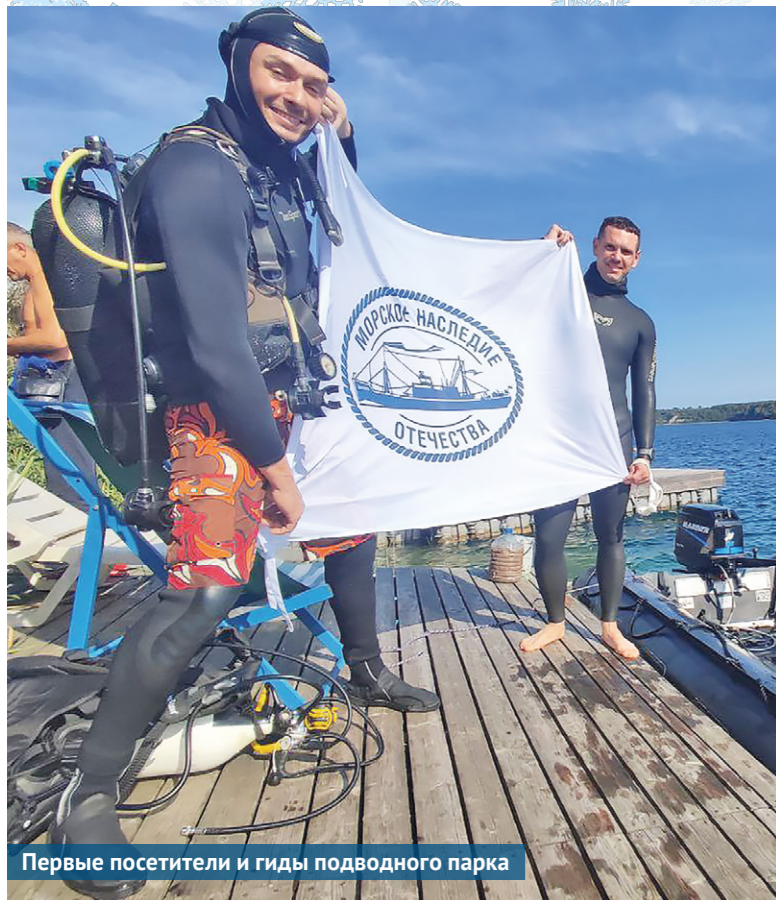
Первые посетители и гиды подводного парка