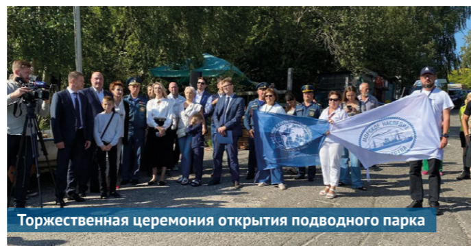
Торжественная церемония открытия подводного парка

22 сентября состоялось открытие самого необычного выставочного пространства. Подводный парк «Янтарный» – это совместный проект музея-заповедника «Музей Мирового океана» и фонда «Морское наследие Отечества». Реализовать его помогла грантовая поддержка Русского географического общества.