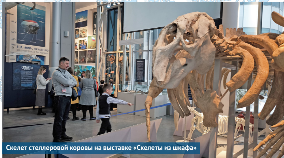
Скелет стеллеровой коровы на выставке «Скелеты из шкафа»

Самое появление выражения «скелет в шкафу» связано с медициной. Врачам в Британии до 1832 года не дозволялось работать с мёртвыми телами. Доступными для вскрытия были тела казнённых преступников. Врачи чаще всего стремились сохранить скелет для научно-исследовательских целей, но открыто не афишировали это. По этой причине всех врачей подозревали в том, что они прячут скелеты в шкаф, подальше от посторонних глаз.