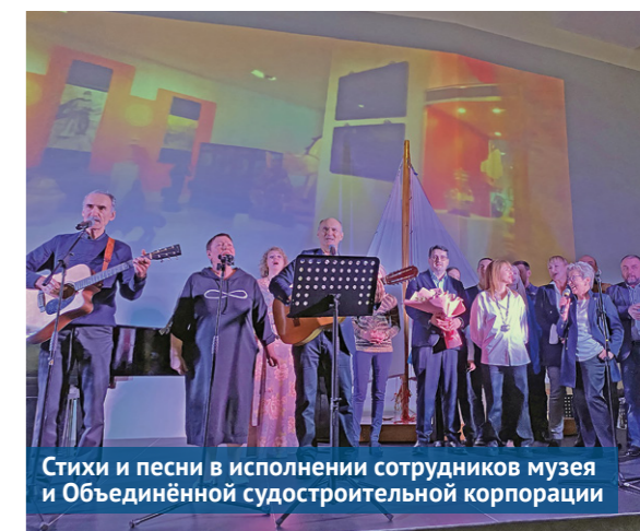
Стихи и песни в исполнении сотрудников музея и Объединённой судостроительной корпорации