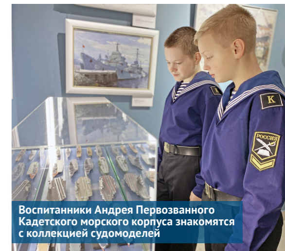
Воспитанники Андрея Первозванного Кадетского морского корпуса знакомятся с коллекцией судомоделей