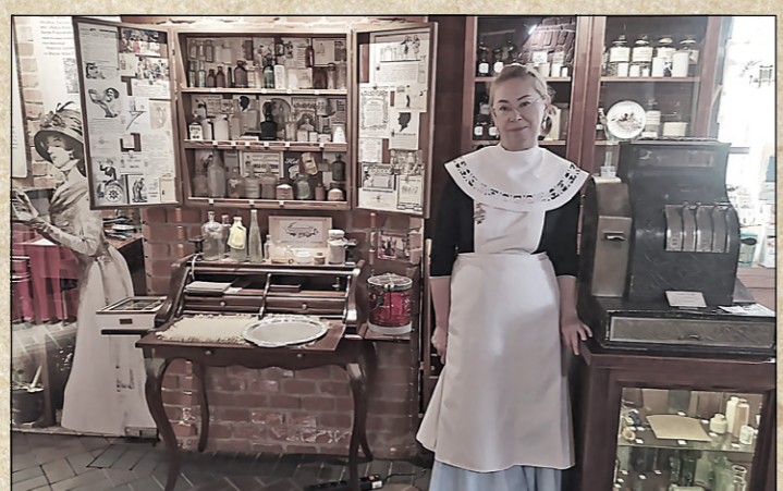
В Королевских воротах Музея Мирового океана

В первом зале собраны материалы об истории Кёнигсберга, оборонительном кольце, городских воротах. Здесь можно увидеть план города и заглянуть в «Прошпективический» ящик. Предметы во втором зале «рассказывают» об исторических связях города с Россией, посещении его выдающимися людьми, истории Великого посольства Петра I, времени Семилетней войны, когда город находил-