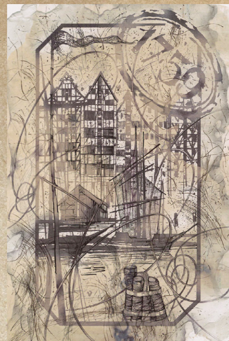
Исаев И. В. Жикле. «Город»

Рисунки составили отдельную выставку. Выполненные профессиональным